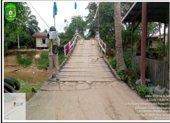
FOTO SURVEY KONDISI JALAN KABUPATEN TAHUN 2023 RUAS JALAN : MENAMANG KIRI

Jalan Wolter Monginsidi Komplek Perkantoran Pemkab. Kutai Kartanegara Tenggarong 75511