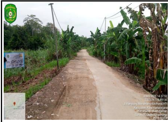
FOTO SURVEY KONDISI JALAN KABUPATEN TAHUN 2023 RUAS JALAN : MENAMANG KIRI

Jalan Wolter Monginsidi Komplek Perkantoran Pemkab. Kutai Kartanegara Tenggarong 75511